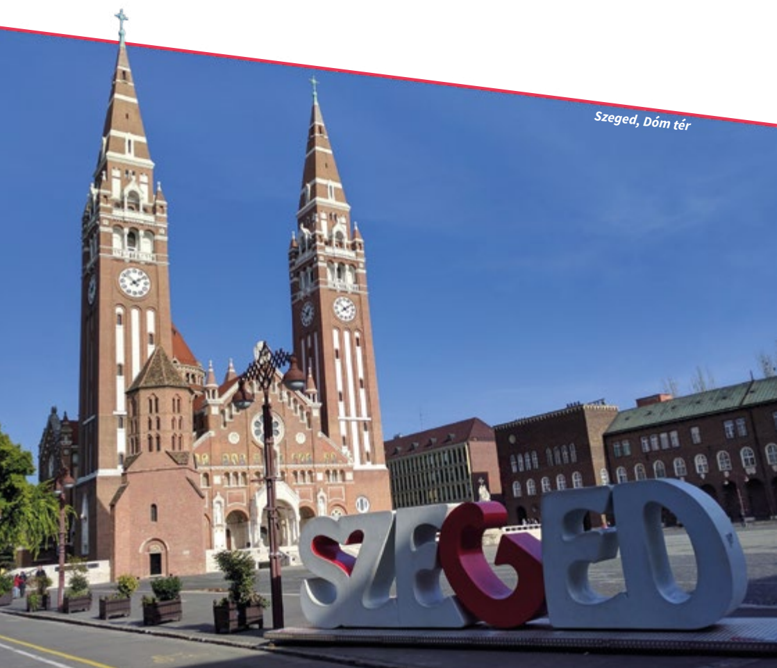
Szeged, Dóm tér

A Hunguest Hotel Forrás Szeged éttermében büféebédet biztosítunk szeptember 13-14-én.